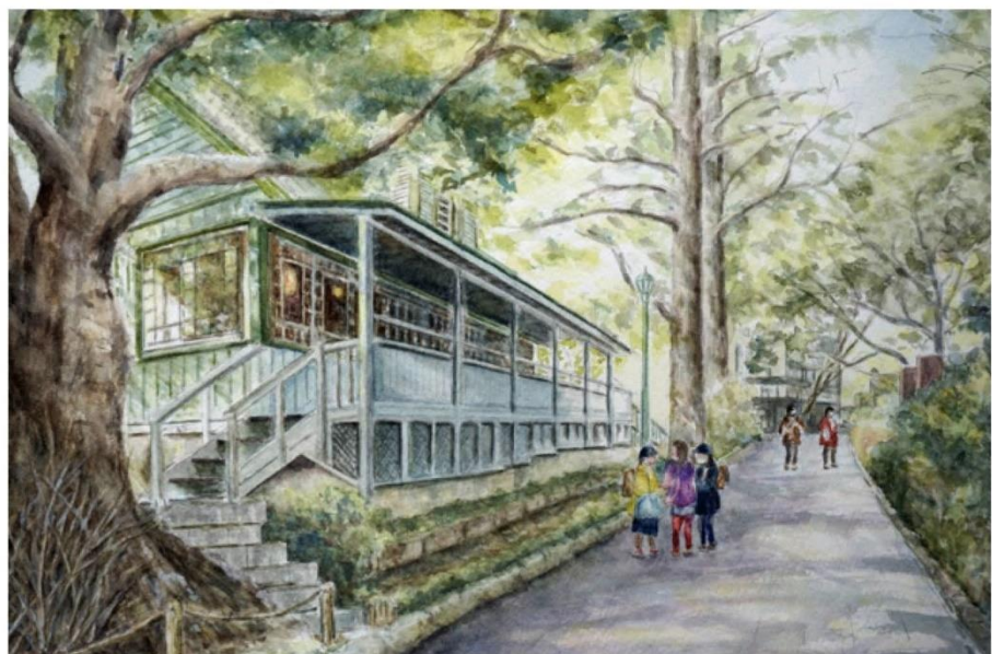
大島 啓二「横浜・山手 テニス発祥記念館」