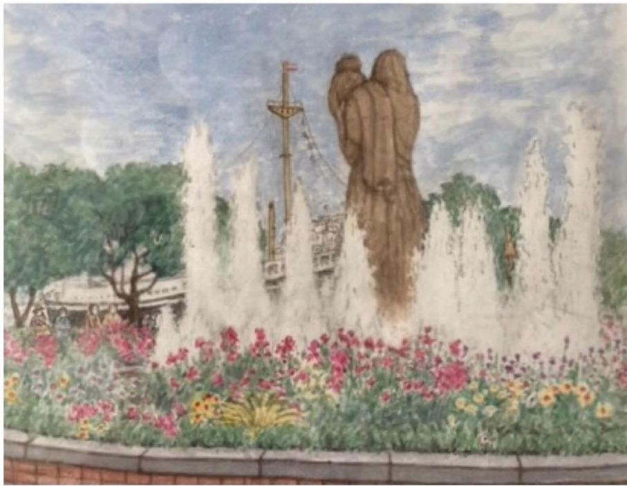
金原 良三「山下公園噴水」